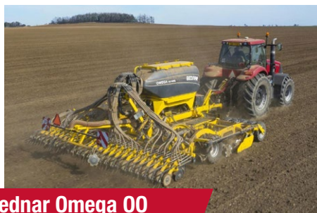
Bednar Omega 00 6000 L (utolsó darab)