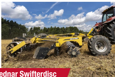
Bednar Swifterdisc XO 6000 F