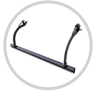
HÁTSÓ FOGAS SIMÍTÓ LÉC (SWIFTER)