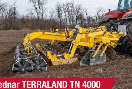
Bednar TERRALAND TN 4000 HD7R PROFI (demózott)