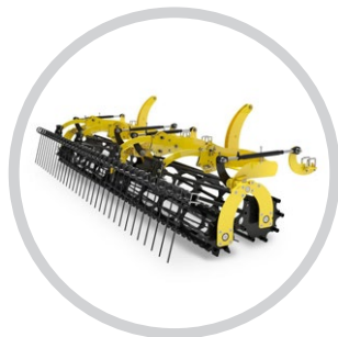
DUPLA LEZÁRÓ HENGER CSIPKÉS LÉCCEL + GYOMFÉSŰ (VERSATILL)