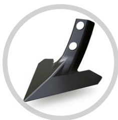
SB KAPA 200 MM