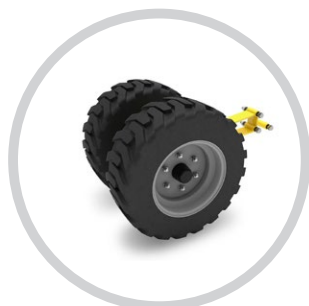
MELLSŐ MÉLYSÉGTARTÓ KERÉK 2.0