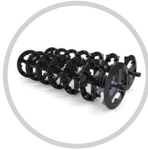
ABSZOLÚT DUPLA CROSSKILL HENGER (SWIFTER)