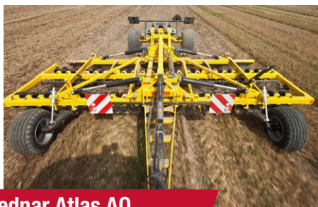
Bednar Atlas AO 5000 Profi (demózott)