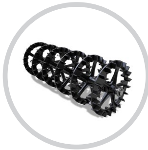
SZIMPLA CROSSKILL HENGER 440 MM (SWIFTER)