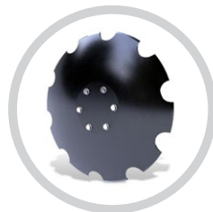
CSIPKÉS TÁRCSALAP 660x6 mm