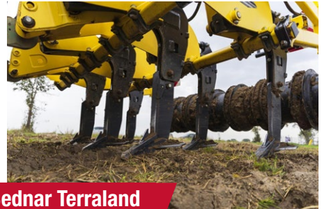
Bednar Terraland TN 3000 D7R