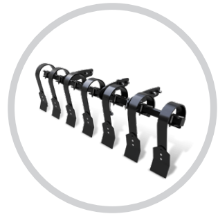
HIDRAULIKUSAN ÁLLÍTHATÓ MELLŐ CRUSHBAR (SWIFTER, SWIFTERDISC)