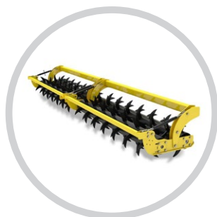
DUPLA TŰSKÉS HENGER (TERRALAND)