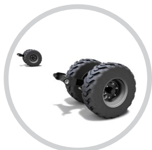
MELLSŐ MÉLYSÉGTARTÓ KERÉK