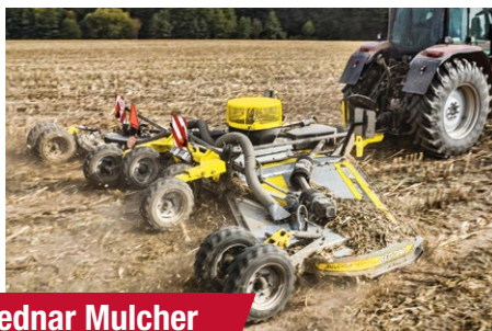
Bednar Mulcher MM 7000