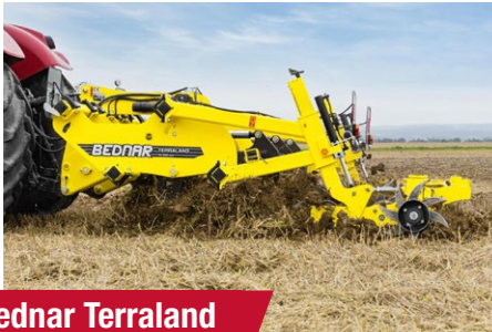
Bednar Terraland TN 3000 M5R