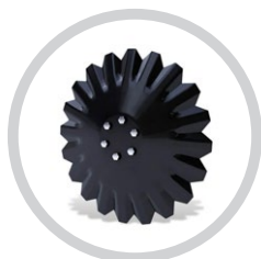
AGRESSZÍV TÁRCSALAP 620x6 mm