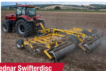
Bednar Swifterdisc XO 8000 F