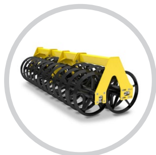
DUPLA V-GYŰRŰS HENGER