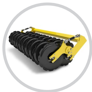
DUPLA PRESSPACK HENGER