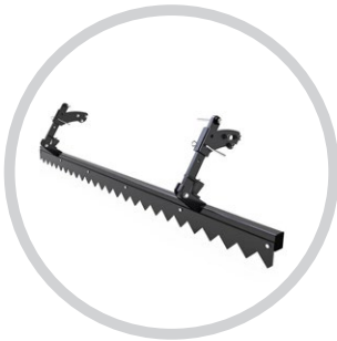
MECHANIKUSAN ÁLLÍTHATÓ FOGAS SIMÍTÓ LÉC (SWIFTER)