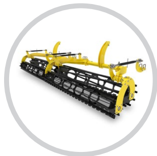
DUPLA LEZÁRÓ HENGER CSIPKÉS LÉCCEL (VERSATILL)