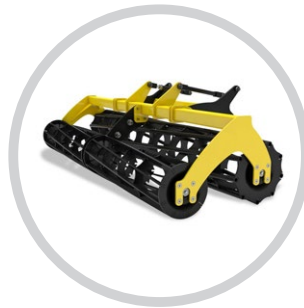
KÉTSOROS LÉCES HENGER