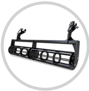
LEZÁRÓ HENGER (SWIFTER)