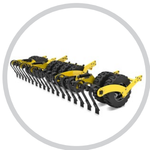
MELLSŐ ELMUNKÁLÓ + CRUSHBAR SOR (OMEGA)

Vetőgépeink előnye az innovatív szerkezeti kialakításukban rejlik, amely lehetővé teszi az egyes vetőgépek felszereltségének módosítását a gazdálkodás körülményeinek, az elsődleges alkalmazásnak és a főszezonban történő használatnak megfelelően.