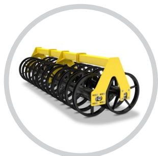
DUPLA U-GYŰRŰS HENGER