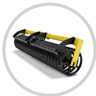
SZIMPLA V-GYŰRŰS HENGER