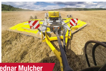
Bednar Mulcher MZ 4500